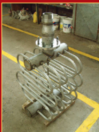
Enfriador Biogás 1kW

También somos representantes de marcas especializadas en la fabricación de equipos con tecnología francesa aplicada especialmente al biogás.