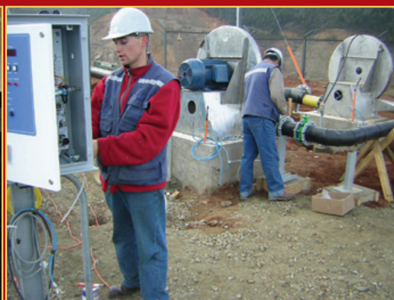
Montaje Analizador & Sopladores Biogás