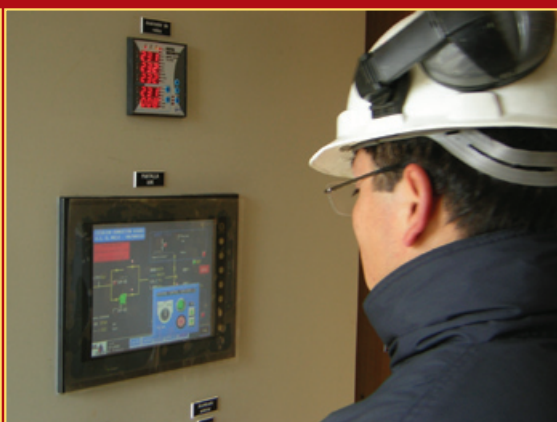
HMI Control Planta de Quema 2.000 Nm 3 /h