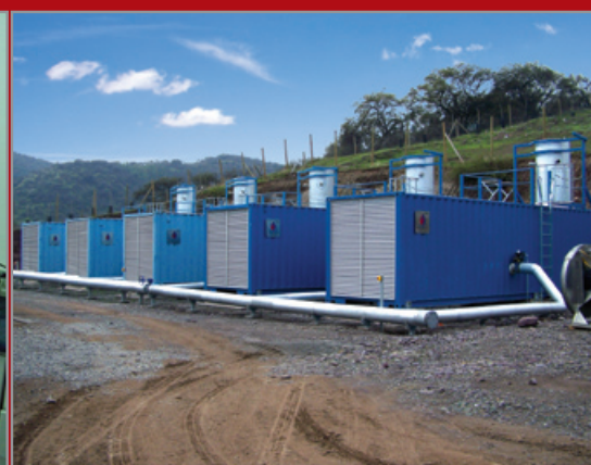
Estación Combustión CSM - 5.000 Nm 3 /h