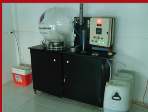
Digestor anaeróbico Piloto – Modalidad ASBBR

Ofrecemos investigar para optimizar el diseño y la construcción de un sistema que se adecue a los requerimientos de sus residuos, realizando pruebas y análisis para asegurar la correcta y segura operación de su planta final .