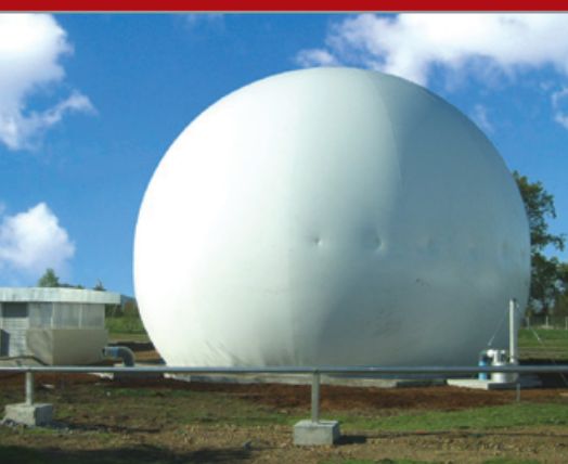
Gasómetro 780m 3 Red Biogás CCU Temuco

AS&D Consultores es una empresa chilena pionera en la ingeniería del biogás que asesora y realiza proyectos desde el año 2004. Somos además el primer desarrollador y fabricante de estaciones de combustión de biogás de manufactura nacional, y uno de los escasos expertos y diseñadores de plantas y redes de biogás con la capacidad de manejar íntegramente un proyecto, desde la asesoría conceptual hasta la puesta en marcha, incluyendo el suministro de equipos especiales para tal aplicación.