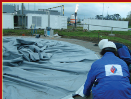
Montaje Gasómetro 780 m 3 en Temuco - Chile